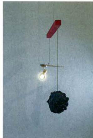
BORIS ACHOUR Conatus: La rose est sans pourquoi, Frac Champagne-Ardenne.