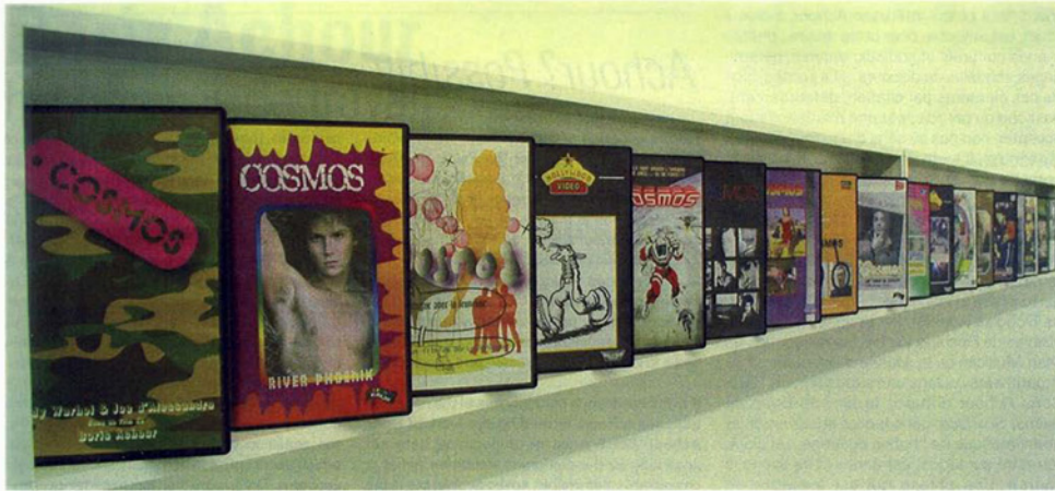
«Cosmos» (détail). 2002. Jackets, boîtiers, étagères de mélaminé, DVD vidéo. Dimensions variables. (Coll. Frac Paca). Dustjackets, boxes, melamine shelving

cultive en rien l'ésotérisme, le savant contrôle du mystère et de la révélation. Je crois que Boris Achour préfère comme il le dit lui-même la notion de «rendez-vous», de rencontre avec le visiteur. D'où, peut-être, les formes simples qui en découlent et qui correspondent à un «instant». Cette disposition le distingue en tout cas de dispositifs parfois trop complexes de l'art d'aujourd'hui.