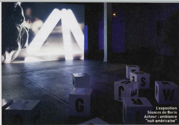
L'exposition Séances de Boris Achour : ambiance "nuit américaine"