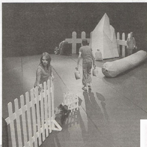
Extrait du film réalisé avec des comédiens dans le décor de Jouer avec des choses mortes .

Jouer avec des choses mortes Aux Laboratoires d'Aubervilliers, 41, rue Lécuyer, 93300 Aubervilliers. Tél.: 0153561590. www.leslaboratoires.org Du mercredi au samedi, jusqu'au 31 janvier. Rencontre avec Boris Achour le 24 janvier à 17h.