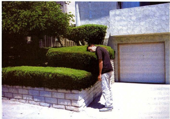
«Somme». 1999. Photographie couleur encadrée. 55,5 x 82,5 cm. (Court. Galerie Chez Valentin, Paris ; Coll. C. Durand-Ruel, Paris). "Nap." Framed color photo

FP: Boris Achour pays attention to the possible in the sense of "that which could be otherwise." This is only distantly related to the idea of utopia, which is too lyrical and grandiloquent. It is a search for a form that can organize the chaos of ideas, resolving the contradictions