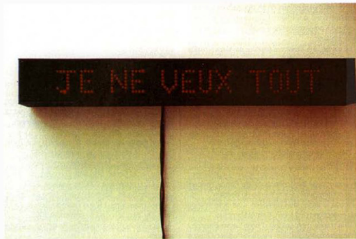
« Je ne veux tout ». 2000. 10,5 x 78,5 x 10 cm. Diodes lumineuses, caisson de bois. (Coll. G. Malavais & F. Miché Paris). « I (Don't) Want It All. » Luminous diodes, wooden box

questionner le réel. L'occurrence ou la non-occurrence de l'événement est en soi déjà un réel, tout autant que l'absence de nécessité n'est évidemment pas la même chose que l'absence de raison.