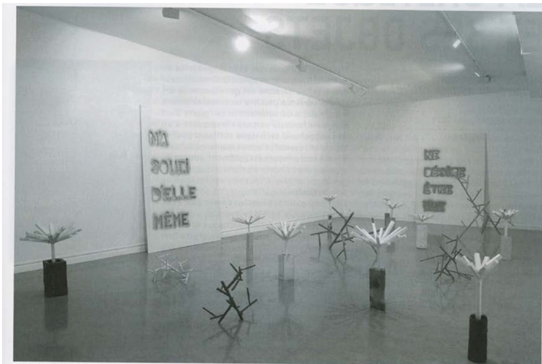
Vue de l'exposition de Boris Achour Conatus : La rose est sans pourquoi au Frac Champagne-Ardenne, 2009.

qu'ils pourraient être également : une illustration en acte de la scientia intuitiva spinoziste. Le problème de la détermination des moments permettant de réaliser l'équilibre d'un mobile est assez proche de l'exemple utilisé par Spinoza pour illustrer ce qu'il entend par science intuitive 7 : la détermination d'un nombre proportionnel à partir de trois nombres donnés. Cette détermination peut se faire par le calcul, en appliquant la règle de l'égalité des produits en croix, ou par intuition. Les Sunflowers , que l'artiste présentait ici pour la première fois, s'offraient comme une traduction tridimensionnelle assez efficace d'une sorte de dessin enfantin, simple et expressif. Le choix du « modèle » ne devait rien au hasard : de toutes les fleurs, le tournesol fait partie de celles qui exhibent le plus leur effort de persévérer dans l'être puisqu'elle se « tourne vers le soleil ». On est