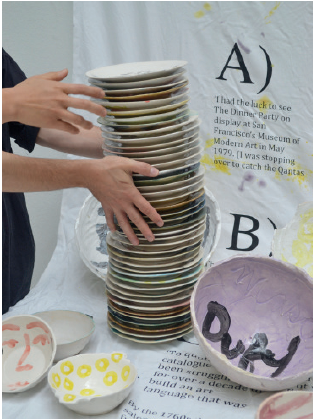
NATSUKO UCHINO with MATTHEW LUTZ-KINOY

KERAMIKOS , 2012 - 2013 Traveling dinner event and ceramics collection