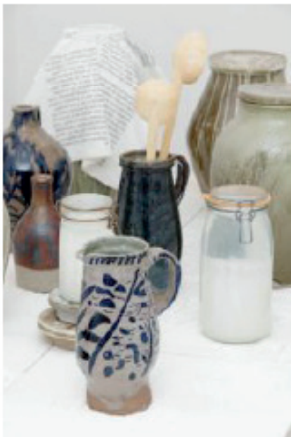
Natsuko Uchino, Scabias , vue d'exposition, Galerie Allen 2020

tour à ses proches. Processus microbiens traditionnels destinés à la réalisation de fromage, de lait caillé ou de boissons fermentées, les scabias sont décrits par Natsuko Uchino comme « une forme d'économie générative » : leur principe même est l'abondance. D'un simple fragment de kombucha, il est possible de faire renaître le tout. Il est d'ailleurs recommandé de ne jamais échanger ces ferments contre de l'argent, pour ne pas tenter les arnaques (on pense par exemple que tous les grains de kéfir de lait actuellement en circulation sont issus d'une seule et même souche, extorquée au XIX e siècle aux habitants des montagnes du Caucase). À l'origine, précise l'artiste, le projet était de transformer la galerie en bar pour boissons fermentées, mais devant l'abondance de la production, il a été décidé de faire évoluer le projet en banque de partage gratuit. Chacun pouvait également apporter une douceur de sa fabrication (confitures, légumes lacto-fermentés) et l'échanger gratuitement sur place avec un autre produit.